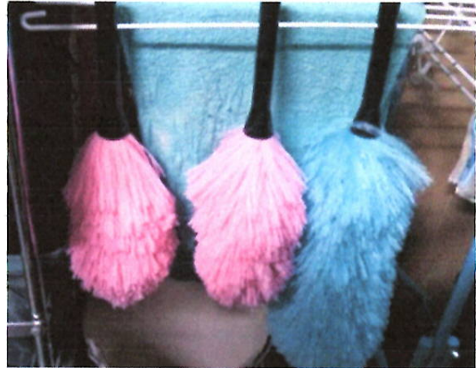
④ 脱水後、吊るして干す